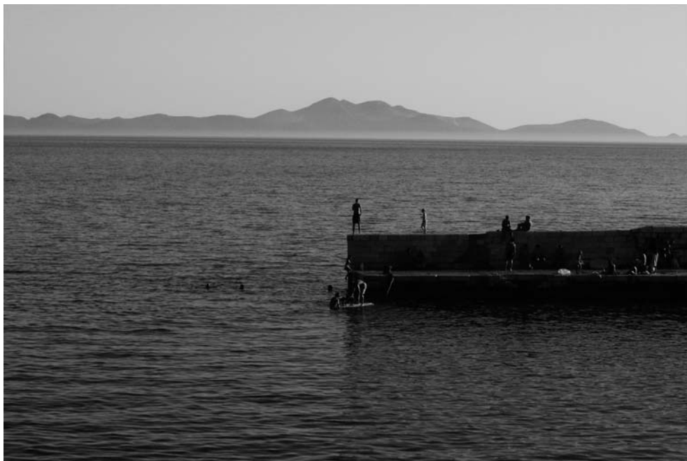
Djeca na molu